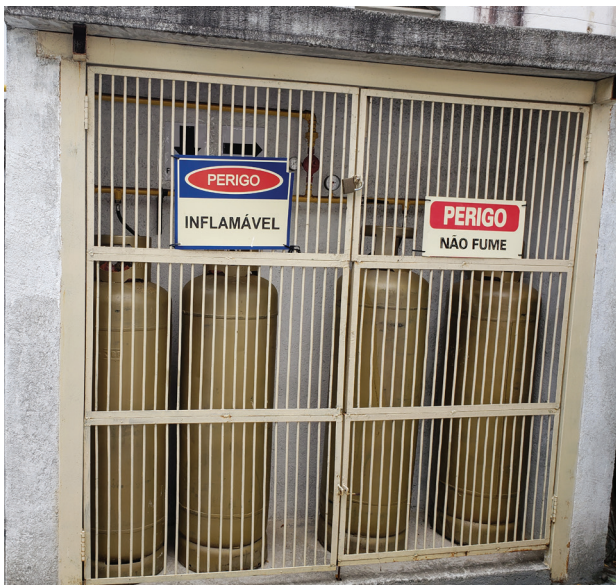
Botijões de gás acondicionados fora da cozinha e utilização de cilindros de 45 kg