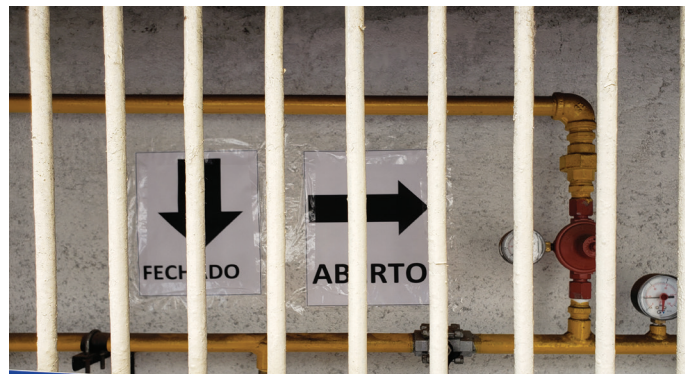
Orientações de uso dos cilindros de 45 kg