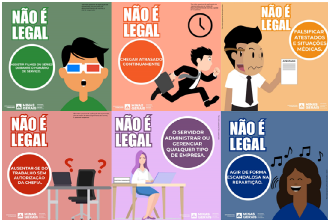
IMAGEM 2 – Campanha “Não é Legal” – SEINFRA 2019, baseada na experiência do Ministério do Planejamento, Orçamento e Gestão.

Outra ação desenvolvida no Estado referente às atividades de prevenção à ocorrência de ilícitos administrativos em 2019 foi realizada pela Secretaria de Estado de Educação de Minas Gerais – SEE, nos termos de orientações técnicas do Núcleo de Correição Administrativa – NUCAD/SEE e da COGE.