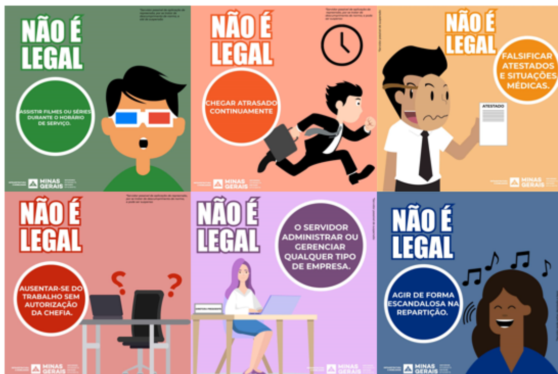
IMAGEM 2 – Campanha “Não é Legal” – SEINFRA 2019, baseada na experiência do Ministério do Planejamento, Orçamento e Gestão.

Outra ação desenvolvida no Estado referente às atividades de prevenção à ocorrência de ilícitos administrativos em 2019 foi realizada pela Secretaria de Estado de Educação de Minas Gerais – SEE, nos termos de orientações técnicas do Núcleo de Correição Administrativa – NUCAD/SEE e da COGE.