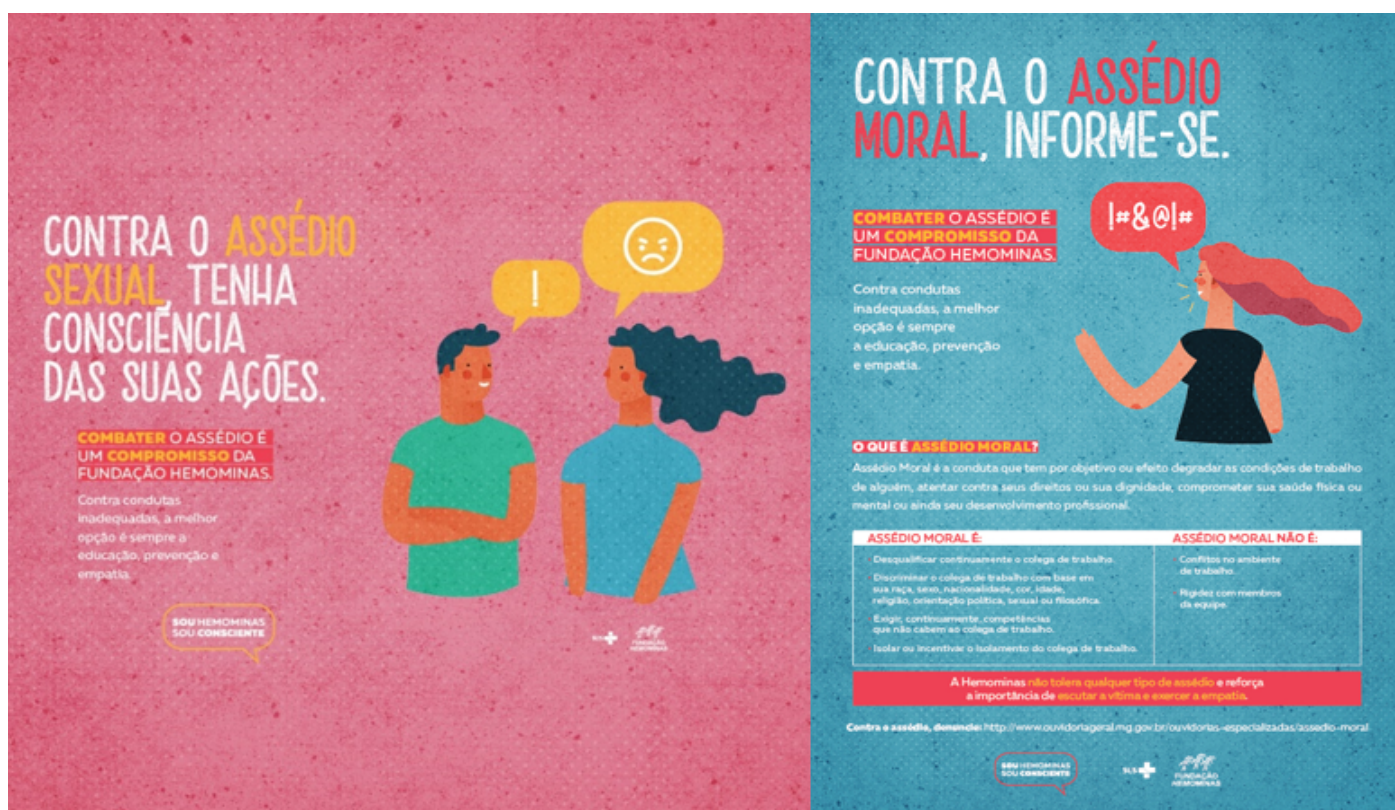
IMAGEM 1 – Campanha de Prevenção ao Assédio Moral e Sexual – HEMOMINAS 2019

A seguir é reproduzido material educativo e informativo integrante das referidas campanhas: